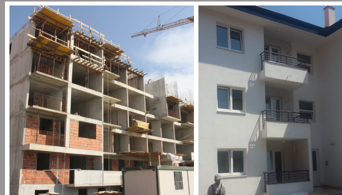
Zgrade neprofitno-socijalnog stanovanja u fazi izgradnje u Prijedoru i Foči - FBiH