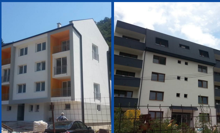
Zgrade neprofitno-socijalnog stanovanja u fazi izgradnje u Pale - Prači i Tuzli

Bosna i Hercegovina je za Vodeću instituciju Državnog projekta stambenog zbrinjavanja u okviru RSP-a, imenovala Ministarstvo za ljudska prava i izbjeglice Bosne i Hercegovine, a implementaciju projekta povjerila je Federalnom ministarstvu raseljenih osoba i izbjeglica, Ministarstvu za izbjeglice i raseljena lica Republike Srpske, te Vladi Brčko Distrikta Bosne i Hercegovine.