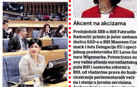
Senka Borovac. Jačanje dobrovoljnog odnosa

Već sada se vidljivi napredak projekta, u smislu da je oko deset posto od ukupnog broja izgrađenih kuća, odnosno stambenih jedinica, sasueno, a oko dvadeset posto u procesu povratka. Regionalni stambeni program nije samo za dobrobit raseljene populacije, već od njega koristi iama region u cjelini, jer stambeni i međa partner, skim zemljama pomalo osnaživanje dobrovoljnih odnosa, doprinosi pomirenju i većoj stabilnosti u regiji, kaže za naš list ministrica za ljudska prava i izbjeglice Bosne i Hercegovine Senka Borovac. Planiranje boravka na vlastiti oginjati i olakšanje integracije u novom mjestu boravka je još aktuelno u re-