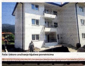
Fotografija: Učestvovanje u izgradnji objekta u Prijedoru