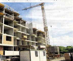
Fotografija: Učestvovanje u izgradnji objekta u Prijedoru